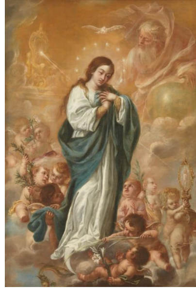
Fig. 6. Juan de Valdés Leal, La Inmaculada concepción , 1682.