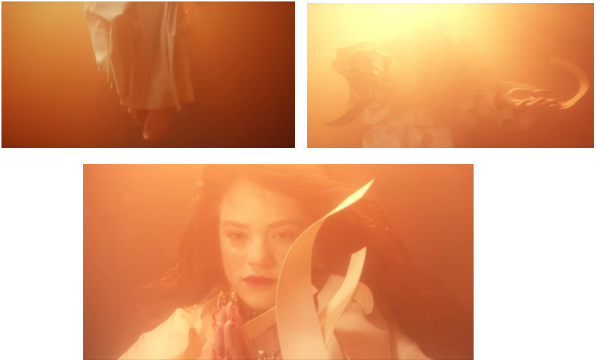
Fig. 12. Helmi (DIVISION), "Bagdad" ("Cap. 7: Liturgia"), 2018.