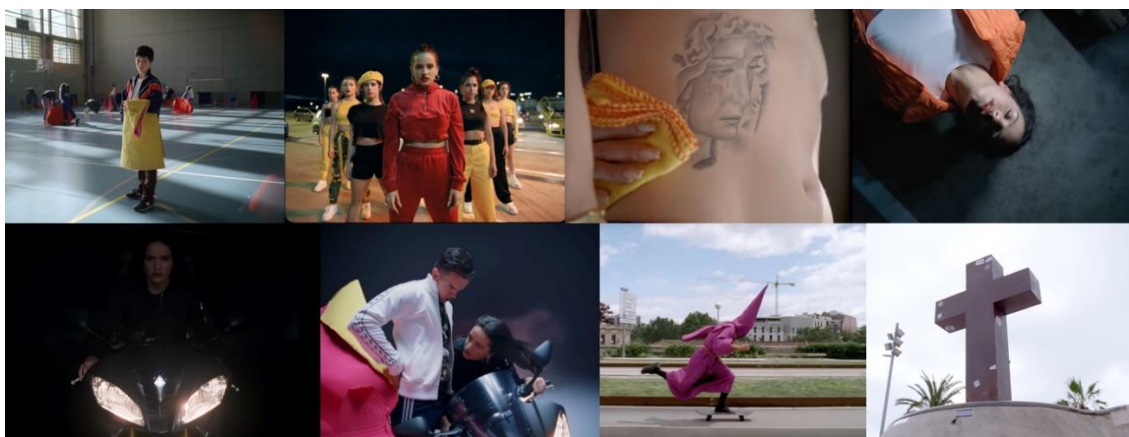
Fig. 11. CANADA, "Malamente" ("Cap. 1: Augurio"), 2018.

En cualquier caso, lo que esta polémica revela es la penetración del debate sobre identidades raciales y discriminaciones históricas en la España del pasado y del presente, y también lo complejo y sutil de muchas lecturas sobre los productos culturales que llegarán en el futuro. Sin embargo, la industria cultural siempre se ha caracterizado por ser devoradora, fagocitadora de las distintas culturas más silenciadas o de lo marginal, de los límites. Pero más que apropiacionista, e incluso expropiacionista, en cuanto a la utilización de esa simbología sagrada, la cantante forma parte de un sistema capitalista caníbal, que todo lo absorbe y, como el mismo Walter Benjamin nos hizo saber, no estaría tan distante de los procesos religiosos (Benjamin 2014).