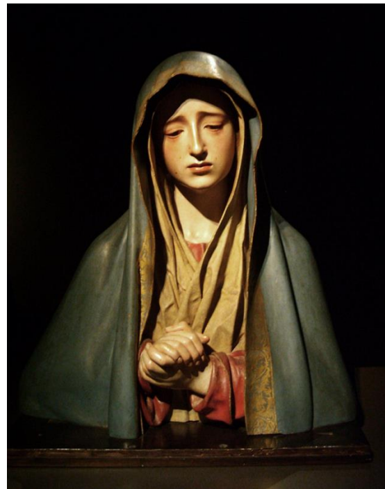
Fig. 14. Pedro de Mena, Mater Dolorosa , c. 1670.