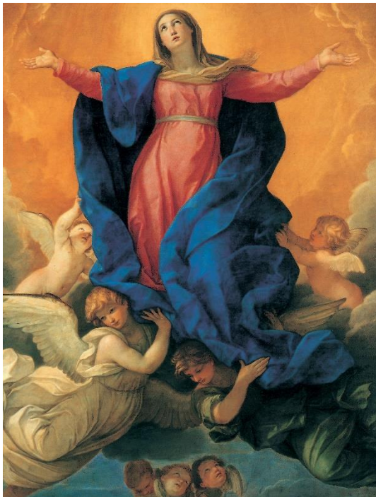
Fig. 13. Guido Reni, Asunción de la Virgen , 1642.