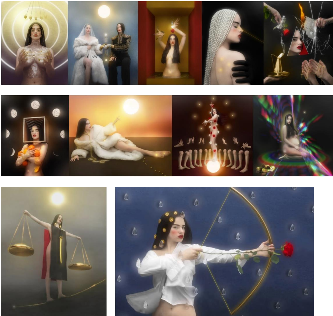
Fig. 7. Filip Cusic, Imágenes de El mal querer , 2018

Para tratar de interpretar estas imágenes, además de atender a otros materiales como pueden ser los compendios de iconografía o los diccionarios de símbolos, es necesario acudir a una fuente de primera mano, que en este caso nos es proporcionada por el propio artista, Filip Cusic, en sus historias destacadas de su perfil de Instagram. Como él mismo deja entrever, en numerosas ocasiones las asociaciones que realiza entre sus creaciones y las tradiciones con las que cuenta son intuitivas y, aunque perdure el sentido simbólico de algunos elementos, éstos se impregnan con nuevos significados para responder al fin último del álbum.