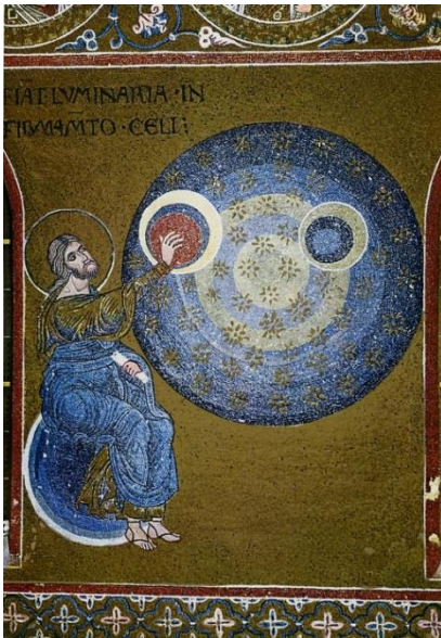
Fig. 9. Mosaico de la Catedral de Monreale, La creación de los astros, 1172-1176.