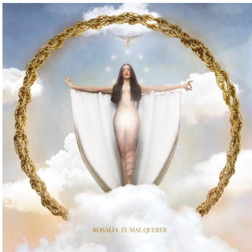
Fig. 3. Filip Cusic, Portada de El mal querer , 2018.

La forma en que se ilustra esta historia, en paralelo a las letras de las canciones, es a través de las imágenes que habitan el interior del álbum y que hacen referencia al proceso de transformación del personaje principal. Filip Cusic, un artista que se siente heredero del universo surrealista, fue el encargado de la creación y disposición visual de las imágenes insertas en el disco. Cusic centra su trabajo en interrogar la relación que el ser humano establece con los objetos y el significado que se esconde tras ellos, mientras lo envuelve todo en un halo cientificista proclive a la imaginación, en donde trata de enfrentar los opuestos en un juego de excepciones. Sobre estas leyes compone once imágenes que corresponden a cada uno de los cortes del disco, siempre arropado por la supervisión y la seguridad que la artista pone en sus ideales estéticos.