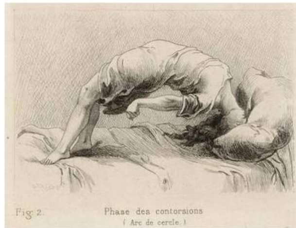
Fig. 16. A. Delahaye y E. Lecrosnier, Phase de contorsions (Arc de cercle) , 1887.

desarrolladas por el famoso doctor Charcot en La Salpêtrière [fig. 16]. El arte, junto con la ciencia, se encargó de representarlas para confrontar a la sociedad con un mal que, en teoría, se podía erradicar, y así reconducir a las mujeres por el camino correcto, que no era más que el camino de la abstinencia, la decencia y el decoro sexual.