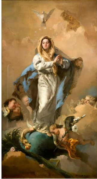
Fig. 5. Giambattista Tiepolo, La Inmaculada Concepción , 1767-1769