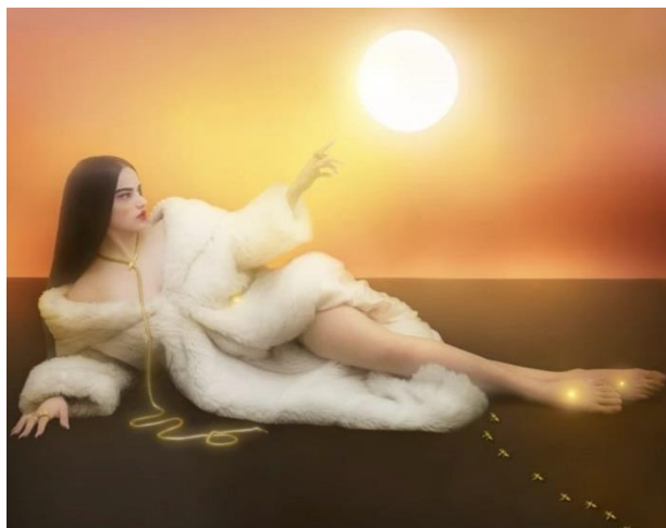
Fig. 8. Filip Cusic, Cap. 7: Liturgia (Bagdad), 2018.

En el "Cap. 7: Liturgia", Rosalía, vestida de blanco, parece situarse a un nivel más allá de lo terrenal, y es presentada, siguiendo la estela de la portada del disco, como un ser divinizado que, en este caso, posee capacidad creadora [fig. 8]. En este sentido, ya no es únicamente un ser feminizado, envuelto de símbolos propios de este género, sino que a partir de este momento es evidente que ha alcanzado un estrato superior tras su clausura y el despertar de los mitos del amor romántico. Como la representación del mismo Dios creador de los astros y del ser humano [figs. 9 y 10], la cantante se muestra sosegada pero poderosa. En suma, es capaz de dominar la serpiente que cuelga de su cuello y, también en alusión a Cristo, de sus pies irradia una luz como último vestigio del dolor. De nuevo, se apuesta por la fusión de atributos propios de la religión cristiana en beneficio de un mensaje popular.