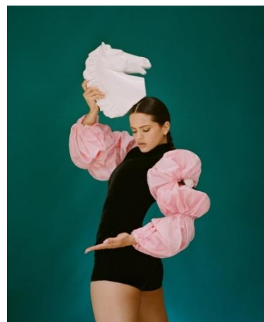
Fig. 2. Camila Falquez, Rosalía para Vogue España , 2018