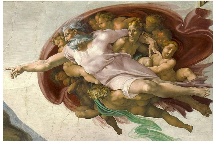
Fig. 10. Miguel Ángel, La creación de Adán (detalle), 1511

En el "Cap. 8: Éxtasis", Rosalía aparece en contrapicado sobre una esfera iluminada, siendo adorada en una especie de tablao flamenco. El título del capítulo asociaría el baile y el cante flamenco a un estado casi catártico que enlazaría con el "Cap. 9: Concepción", donde se muestra encinta. Aquí, adquiriendo una posición similar a algunas de las diosas de la fertilidad clásicas, emerge de una estela de luces de colores que forman una circunferencia y, fuera del círculo, unos zapatos masculinos y dorados completan el relato tradicional de la maternidad, con el padre excluido y ausente.