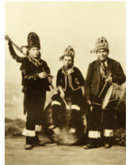
Músicos galegos (Annette M. B. Meakin: Galicia the Switzerland of Spain. Londres, 1909)