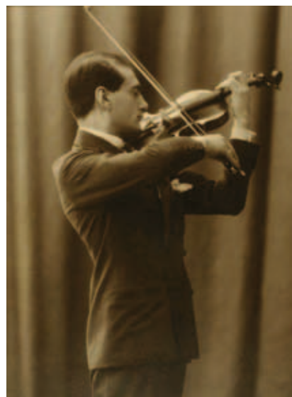
Manuel Quiroga (J. Pintos, ca. 1919) (Museo de Pontevedra)