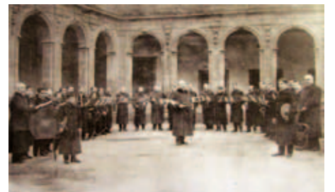
A Banda Municipal de Música de Santiago de Compostela (Vida Gallega, 1909)