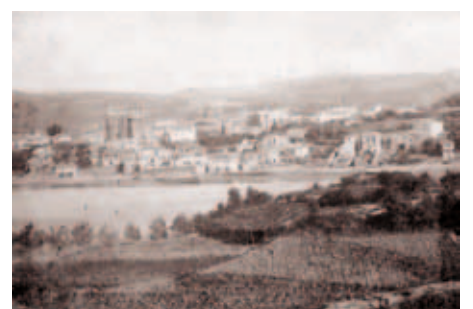
Vista xeral de Pontevedra ca. 1883 (Museo de Pontevedra)