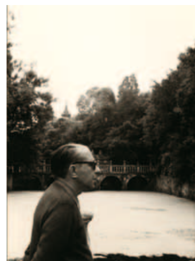
Gonzalo Torrente Ballester no Pazo de Oca (Fundación GTB)